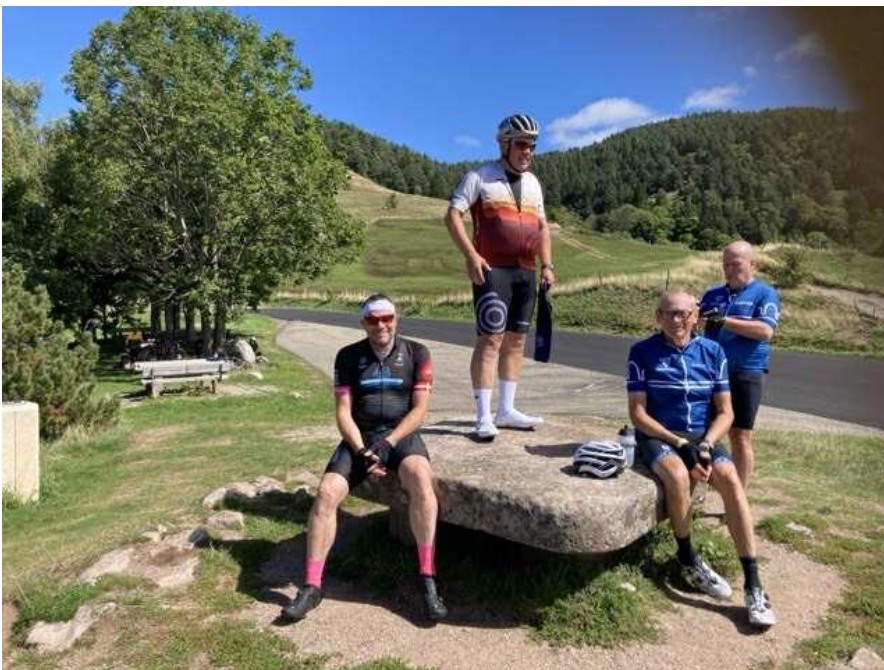
Pause i solen