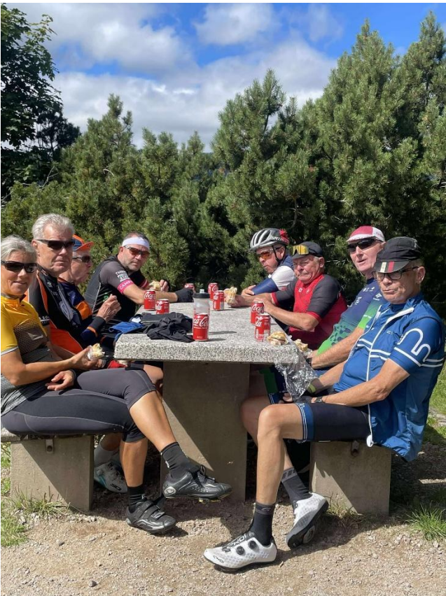
Velfortjent pause og frokost