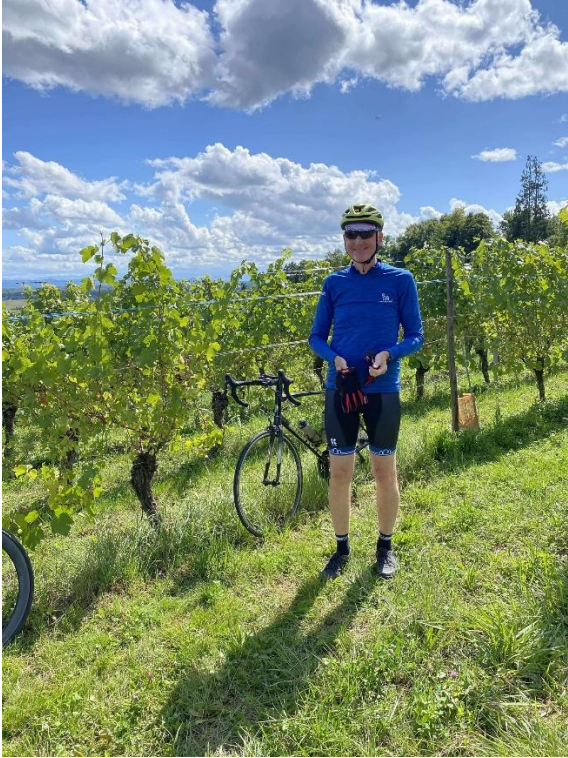
Frokost i vinmarken