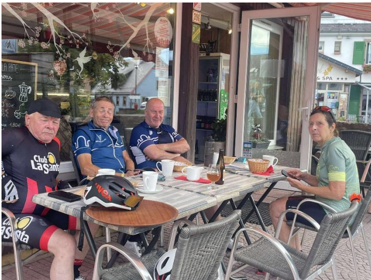
Godt med en kaffepause